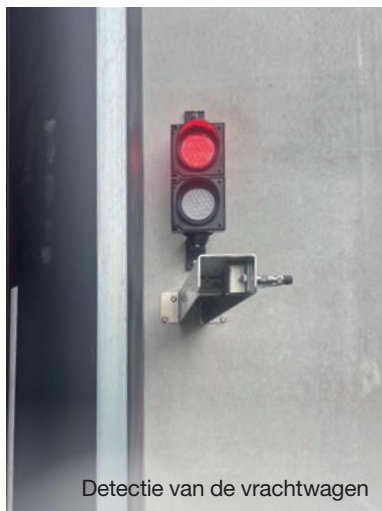
Detectie van de vrachtwagen

Als de oplegger voldoende helt in de richting van de kade, is deze taak overbodig, omdat de zwaartekracht deze functie perfect vervult.